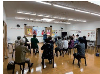
“コミュニティサロン”