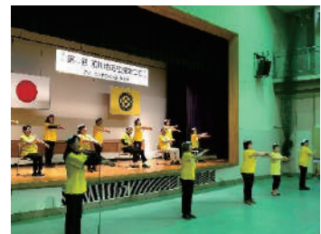
“前川地区社協まつり”