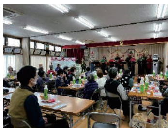
“サロンへの助成事業”