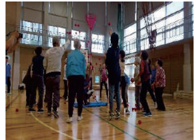
“三世代交流スポーツ レクリエーション大会”