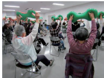
“ふれあいいきいきサロン”