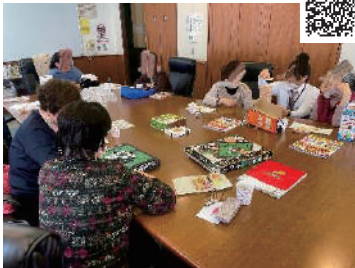
“コミュニティカフェ さざんか”