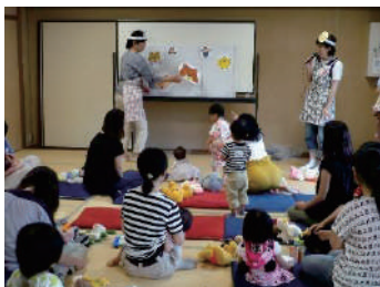
“親子ふれあいサロン”