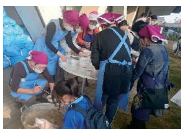
“災害時吹き出し訓練”