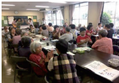
“ホッとサロンー休庵”