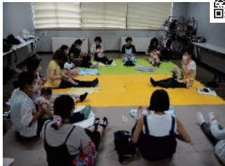
“こそだてサロン さいしょの一步”