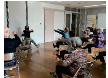
“並木お元気サロン”