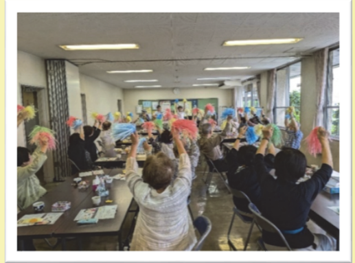
▲ご高齢のかた対象サロン