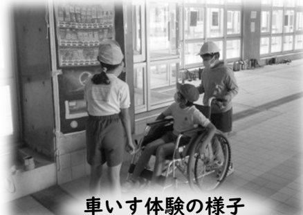
車いす体験の様子