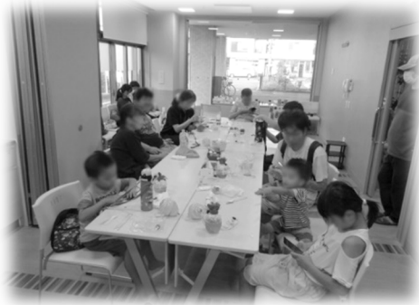
地域拠点活動の様子

コミュニティソーシャルワーカー(CSW)という、制度のはざまにある困りごとの解決を目指す専門の職員を配置し、地域で様々な課題を抱えているかたへの「個別支援」、個別の課題を地域で支えるための「地域支援」に取り組んでいます。