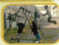
ブランコ好きのみんなね〜