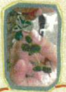
四つ葉のクローバーが たくさん咲いている 秋の行事も...