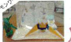
ポケモンワールド