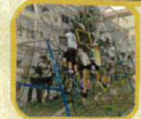
くじの器具が大人気