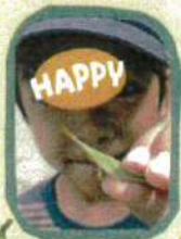
中庭にはパンも いるんだよ〜

今年は、本当〜に暑い夏、夏休みでした。毎日、熱中症警戒 アラートが深夜まで「外遊びは無理かひゃ〜」と思いたずら 我、上青木小には、こんな素敵な中庭があります 朝と夕方、少ない時間でしたが、みんなで元気に外で遊んで ストレス解消し、体が増強(?)になりました。