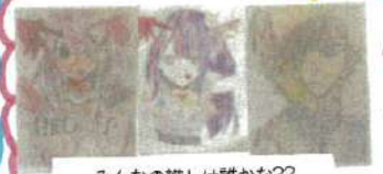
みんなの推しは誰かな??