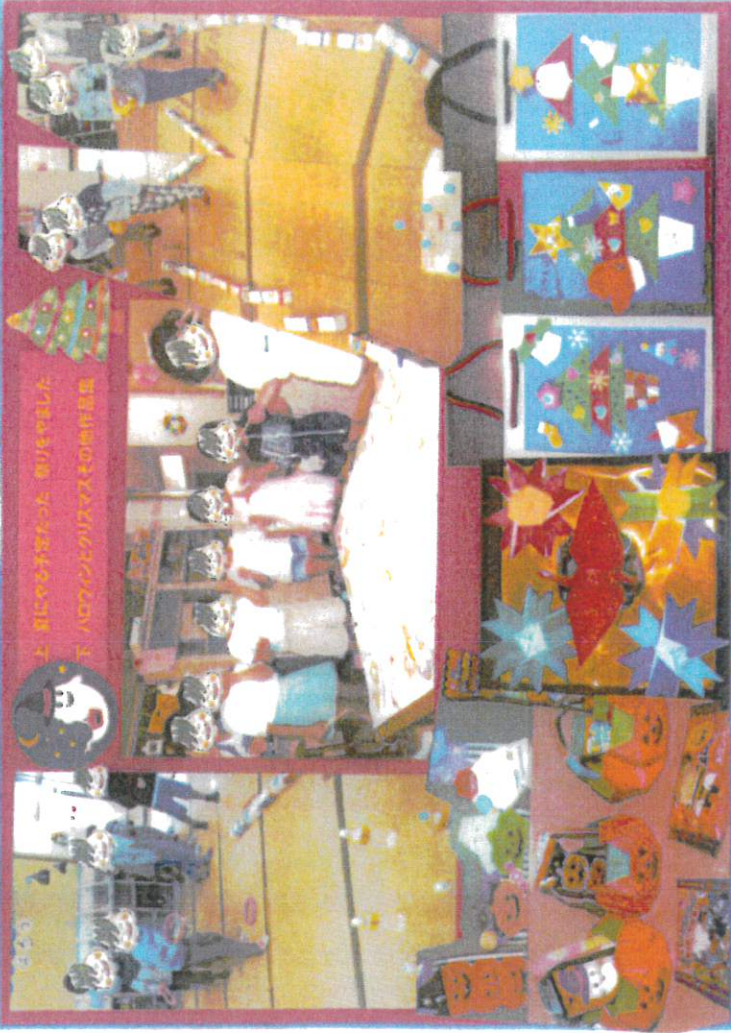
上 劇にやまをかきたて 劇りをやました 下 ハロウィンとクリスマスそれぞれの制作活動