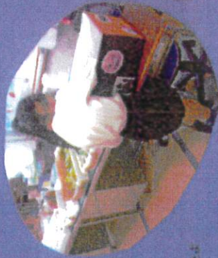
みんなの笑顔が輝いたよ