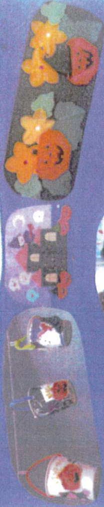
おかし、いっしょに楽しもう