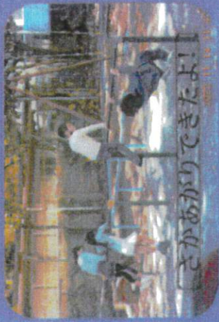
ごかがりできたよ!