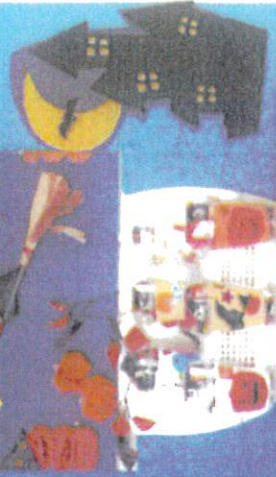
にこちゃんマージョ