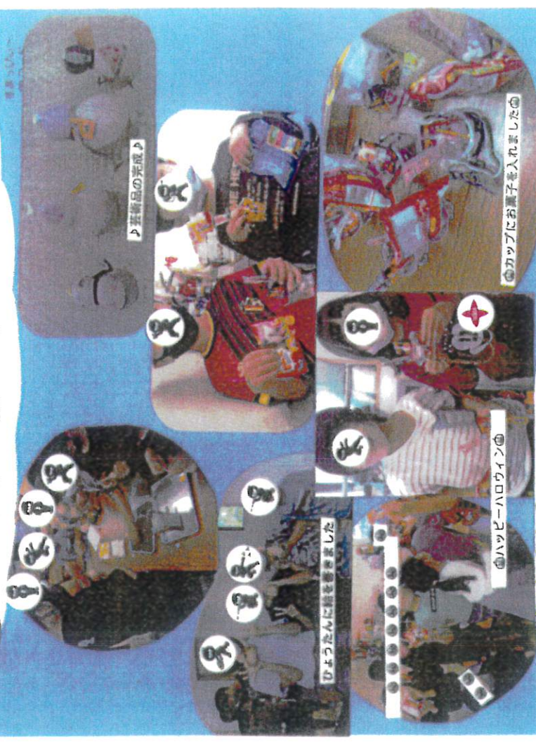
ひょうたんに絵を書きました