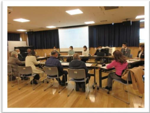
▲第2層協議体の様子