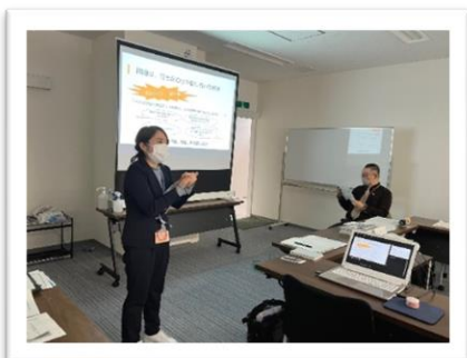
▲第10回第1層協議体の様子