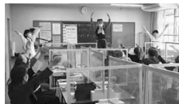
サロン活動の様子