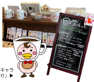
マスコットキャラ 「ふらっとり」▶

川口駅東口キュボ・ラ5階にある「カフェ&ふれあいショップふらっと」。 今年7月に開設20周年を迎えるにあたり、チーフにお話を伺いました。