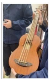
▲ウクレレを持たせていただきました