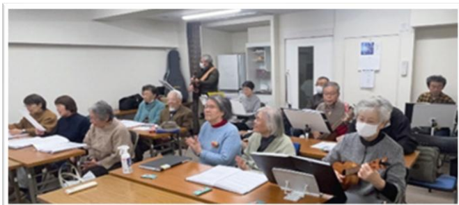
▲演奏している様子