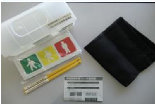
《No10. 視覚障害者体験プレートセット》