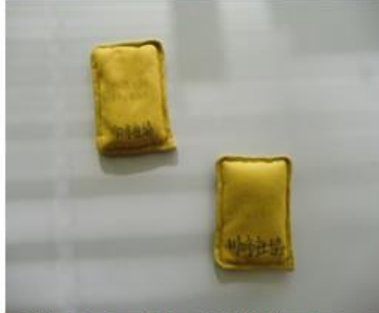
《No6. おもり (ベスト用)》