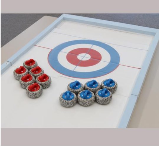
《No 14. カーレット》