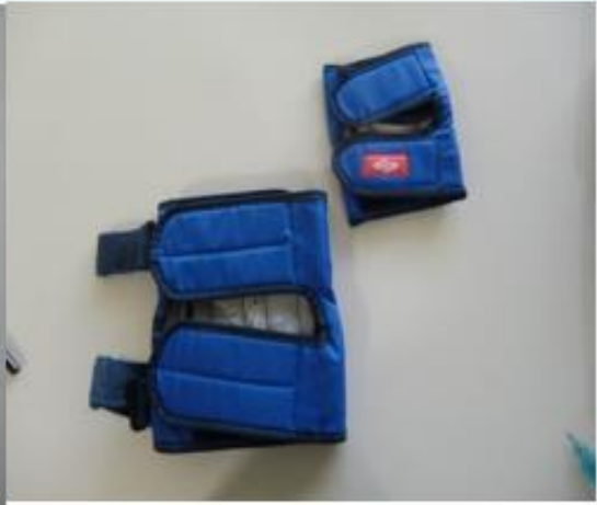
《No8・9. ひじ・ひざサポーター》