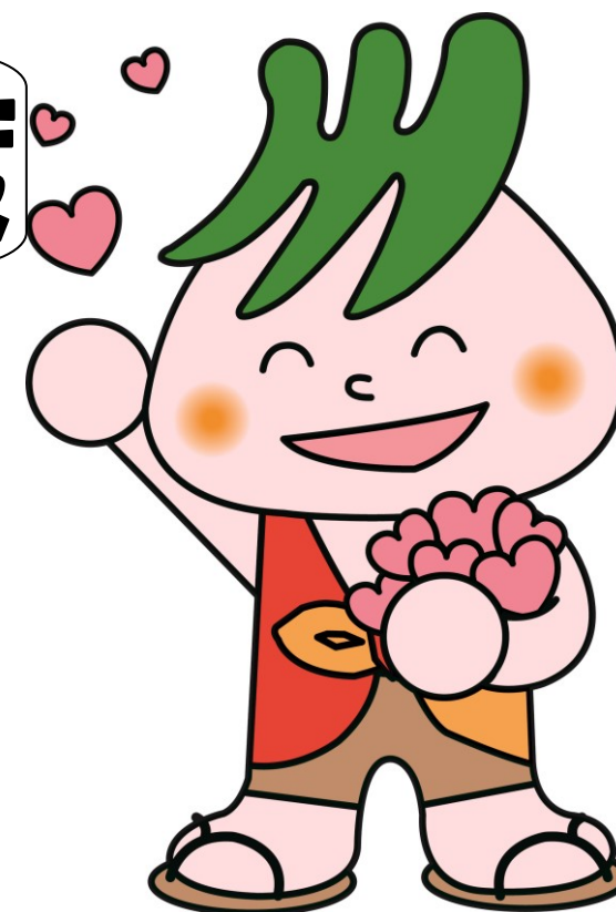
マスコットキャラ 社助（しゃすけ）